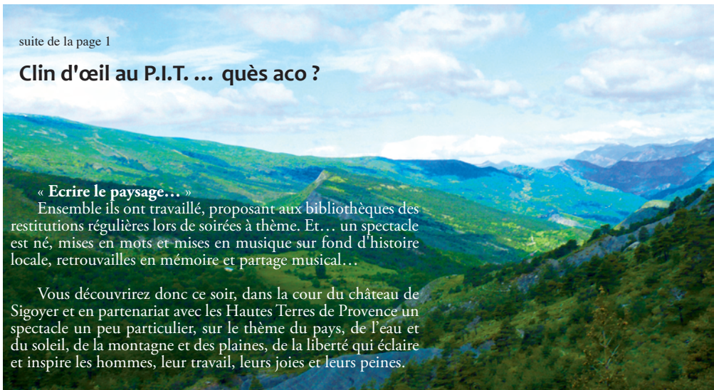
Prospectu' n°5 - Samedi 20 août 2011

Vous découvrirez donc ce soir, dans la cour du château de Sigoyer et en partenariat avec les Hautes Terres de Provence un spectacle un peu particulier, sur le thème du pays, de l'eau et du soleil, de la montagne et des plaines, de la liberté qui éclaire et inspire les hommes, leur travail, leurs joies et leurs peines.