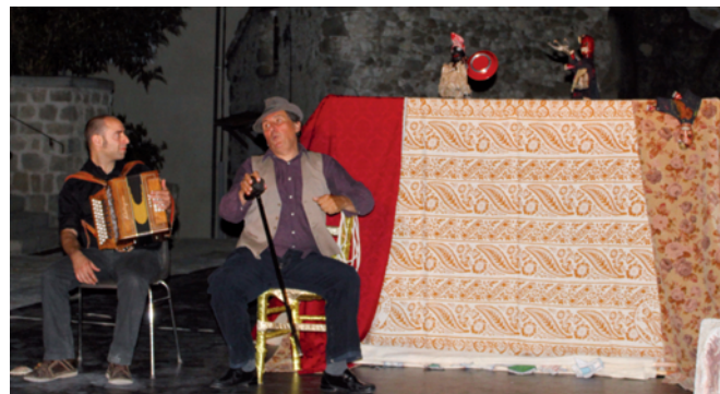
Prospectu' n°5 - Samedi 20 août 2011